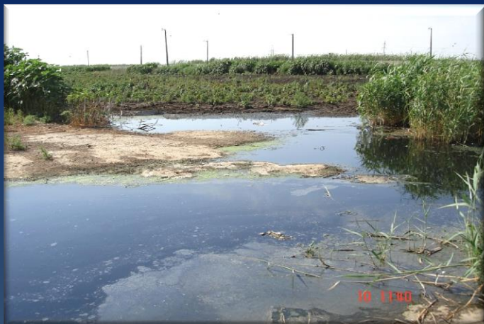
Заполненная иловая площадка (ЗИП)