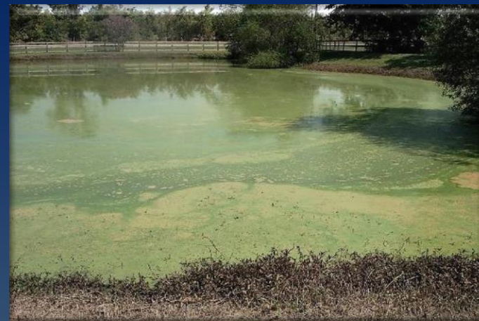
Эвтрофикация водоема, Цветение водорослей