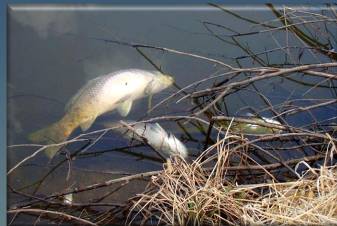
Эвтрофикация водоема, Гибель рыбы