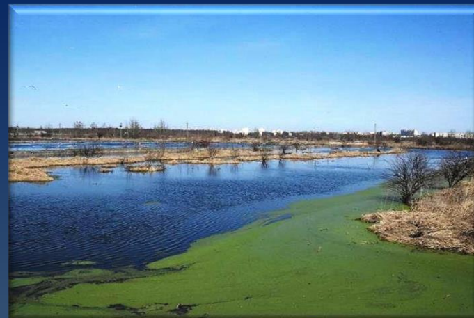
Заболоченная территория из нескольких объединенных ЗИП