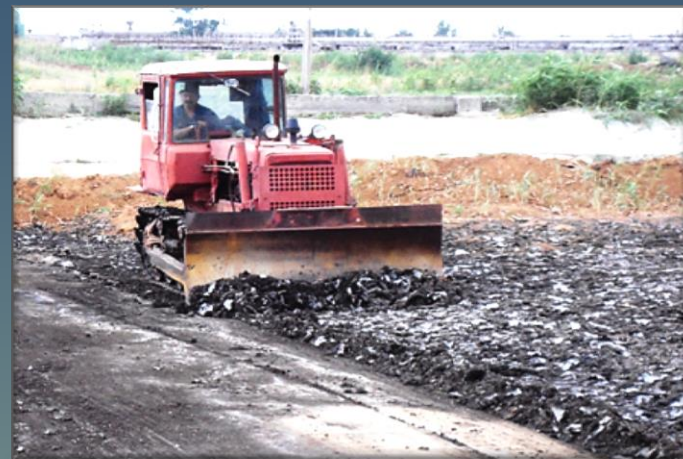
Обезвоженный осадок похож на почву, легко выгружается и не имеет запаха