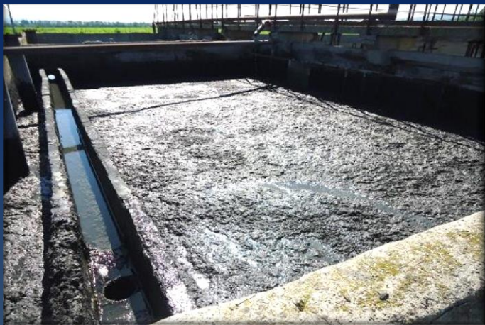
Стабилизация сырого осадка сопровождается резким запахом