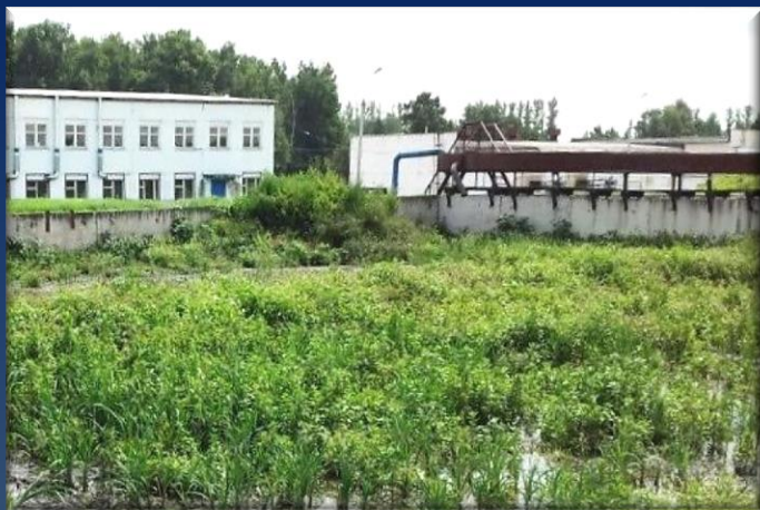
Заполненная иловая площадка (ЗИП) на бетонном основании