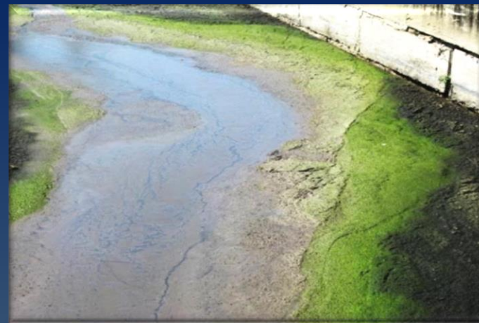
Обезвоживание происходило с низкой эффективностью