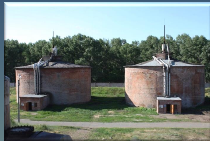
Метантенки практически повсеместно работают с нарушением технологии