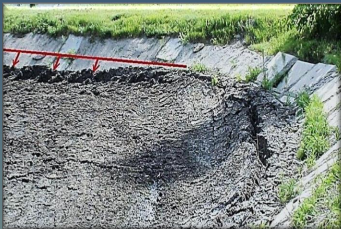
В процессе обезвоживания осадок структурируется и быстро высыхает