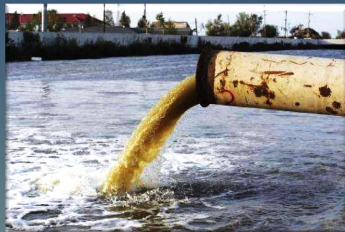
Сброс неочищенных стоков в водоем