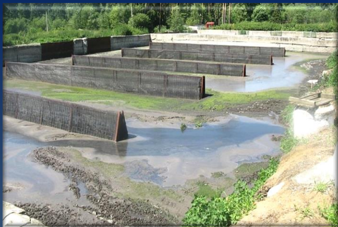
В площадке были установлены сетчатые галереи