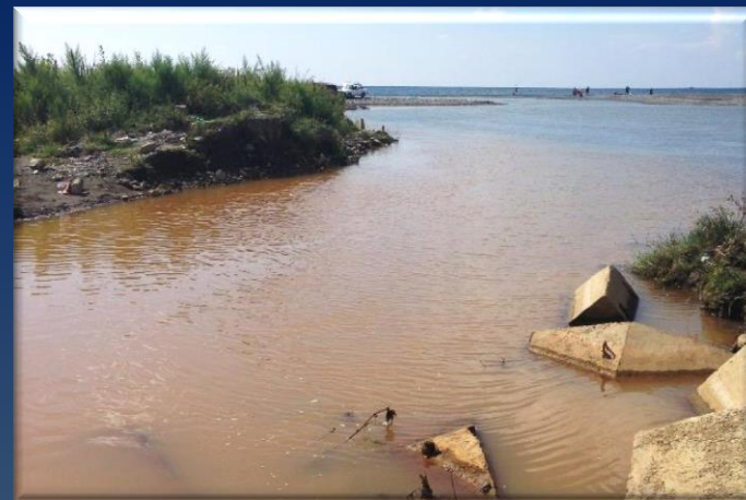
Сброс ила (из вторичных отстойников) в водоем