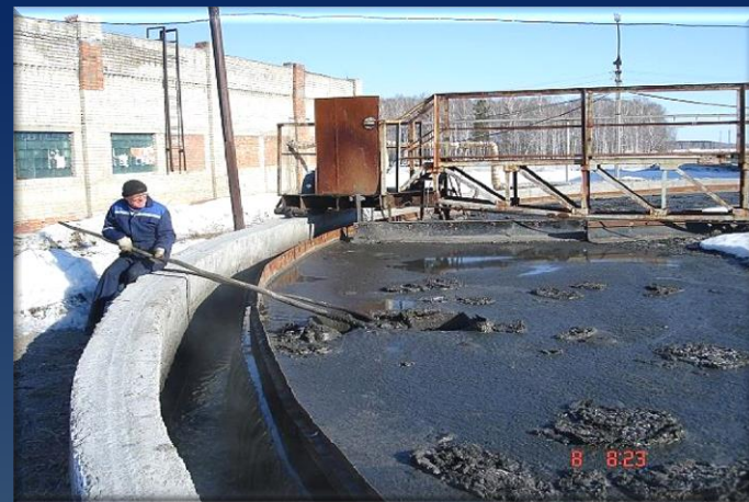
Уплотнение сырого осадка, заметно ухудшает его свойства