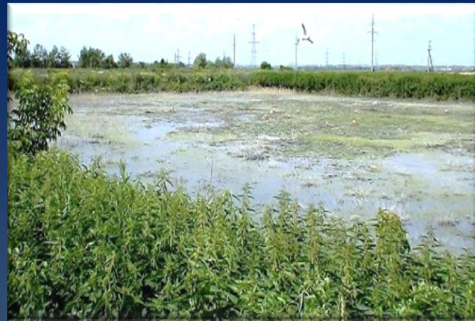
Заполненная иловая площадка (ЗИП) на грунтовом основании