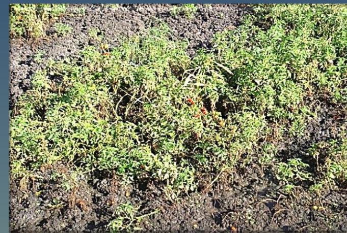
В процессе обезвоживания осадка в иловой площадке за лето вырастают и вызревают помидоры