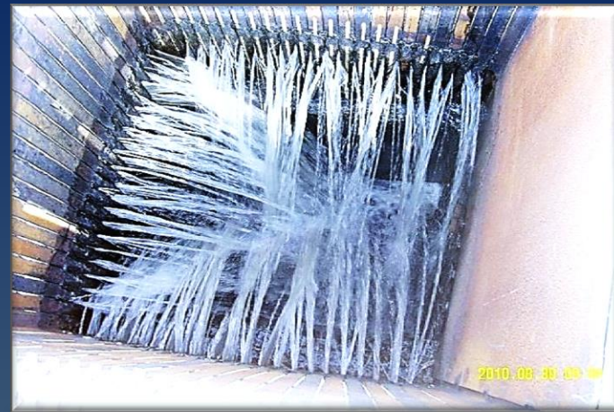
Основной объем воды из площадки отводится через щелевой колодец в течение суток