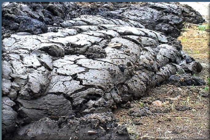
Не подлежащий переработке осадок обезвоженный на центрифуге ( W=75\% ) (в 1т. - вода 750кг, сух. вещество 250кг)