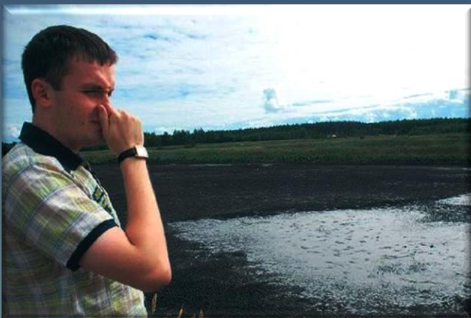
Неправильно подготовленные осадки источают зловонные запахи