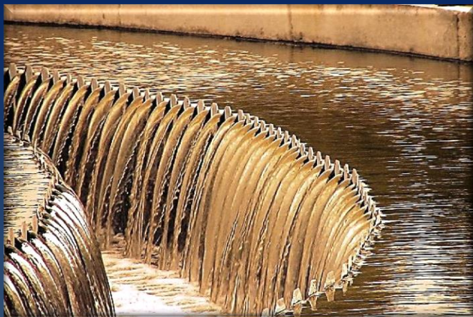
«Вынос» избыточного ила из вторичных отстойников