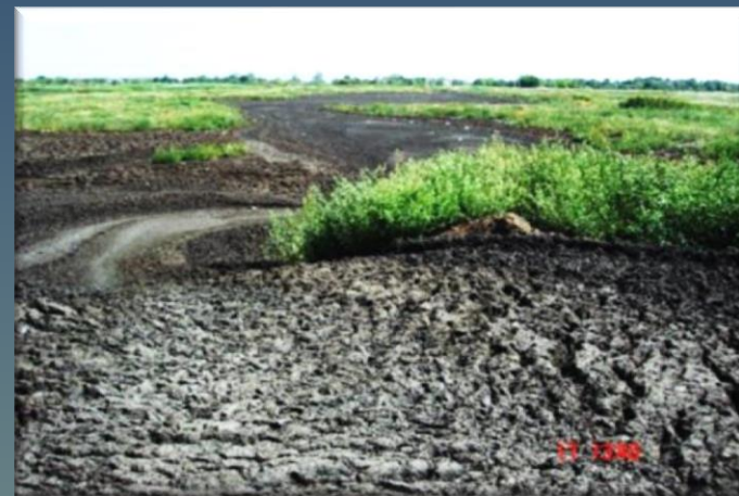
Открытый склад хранения осадка обезвоженного на фильтр-прессе (площадь несколько гектар)