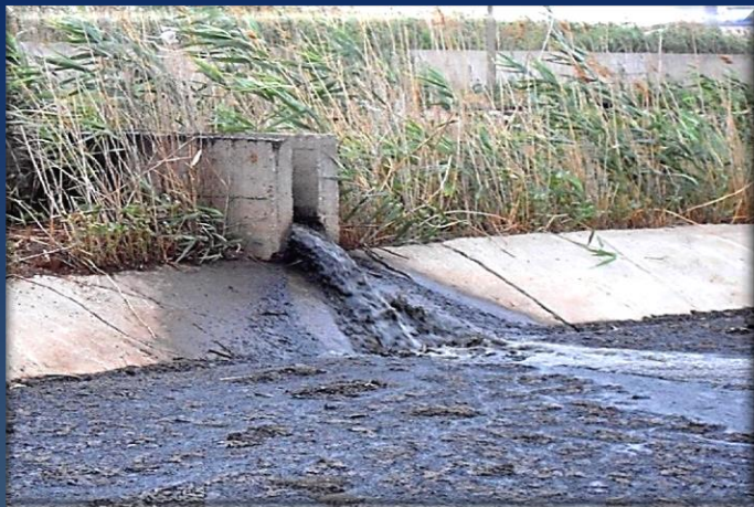
Подача осадка, обработанного флокулянт «Сибфлок®» в иловую площадку