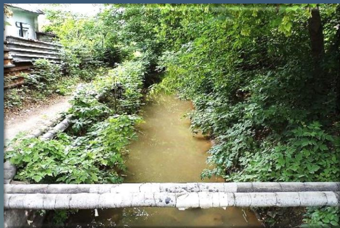
Сброс ила через ручей «обводной канал»