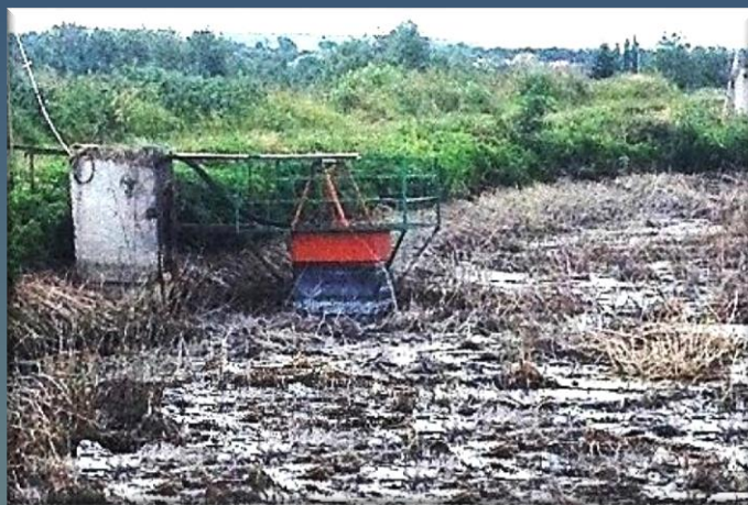
Уровень осадка в иловой площадке после обработки флокулянтom «Сибфлок®», снизился в два раза