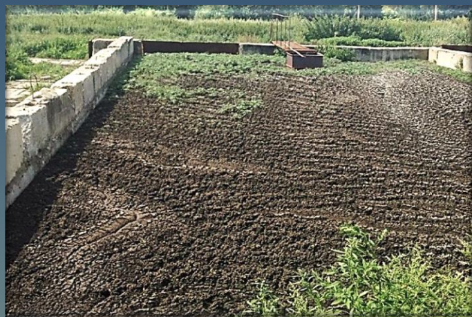
В площадку установлен один щелевой колодец, под действием «Сибфлок®» осадок структурируется и высыхает