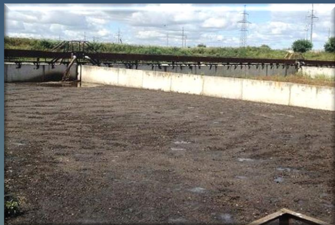
В площадке идет процесс обезвоживания осадков и илов обработанных флокулянтom «Сибфлок®»